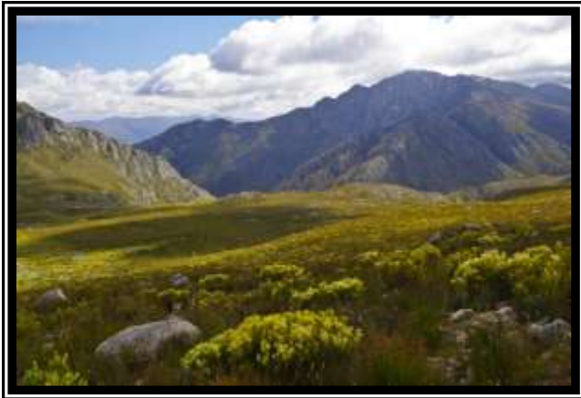
LENTE IN DIE KAMMANASSIE