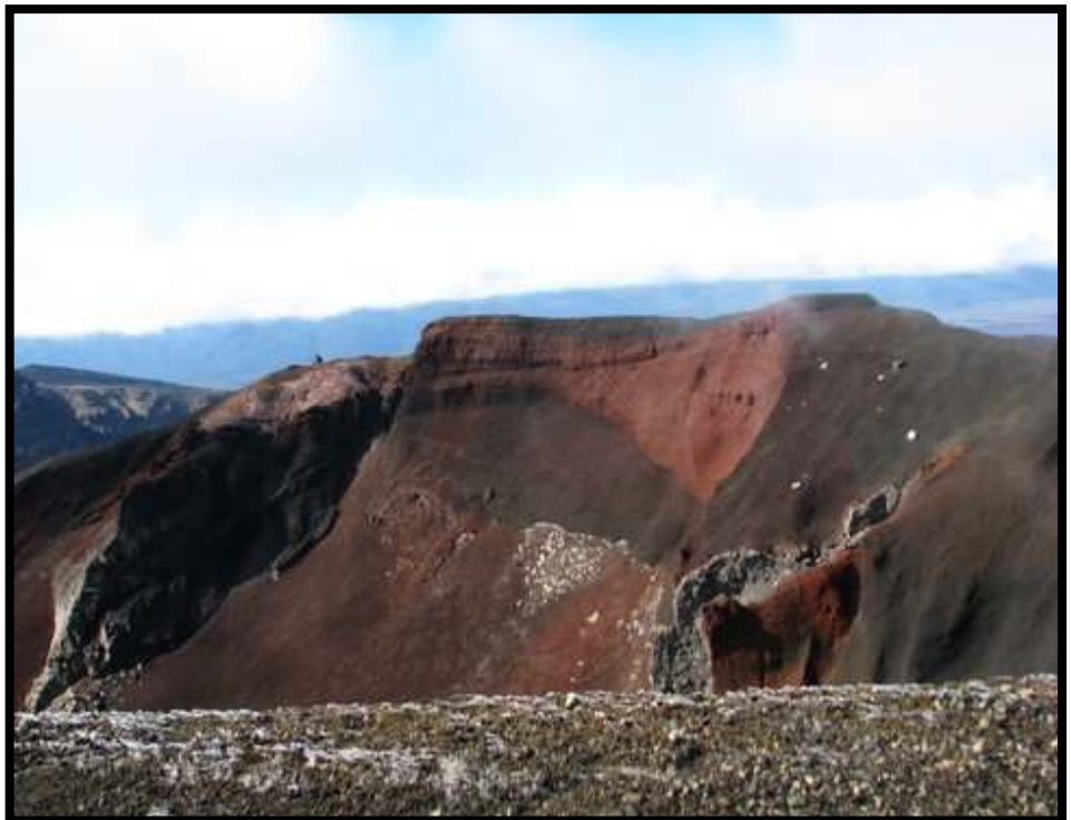
The Red Crater

Voor ons het die paadjie weer skerp afwaarts geloop na die pragtige drie mere, "The Emerald Lakes". Watter