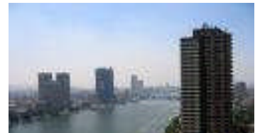
Kaïro op die Nyloewer

Die Niger is die derde langste (4200 km.) in Afrika. Die Zambezi is vierde langste (2700 km). Van die vier grootste Afrika riviere mond net die Zambezi in die Indiese Oseaan uit.