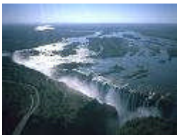
Victoria Valle, Zambezi

Die Niger is die derde langste (4200 km.) in Afrika. Die Zambezi is vierde langste (2700 km). Van die vier grootste Afrika riviere mond net die Zambezi in die Indiese Oseaan uit.