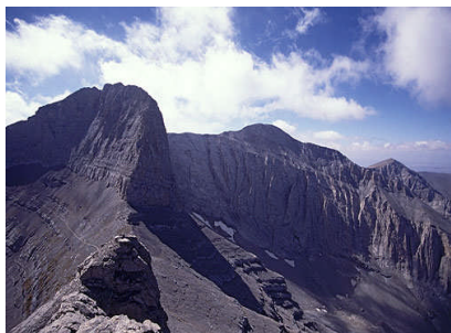
Mt. Olympus, Greece

(An indication of what could have been. We don't have members that young. It is too late to apply now anyway - Ed.)