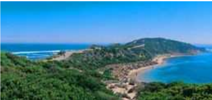
Point Nepean National Park

Ek het heelwat tyd in die Mornington Peninsula buite Melbourne deurgebring. Op die punt van die skiereiland is die Point Nepean National Park waar daar 'n aantal oulike voetslaanpaaie kuslangs is. Wees net versigtig vir die rowwe see. Dit is die gebied waar Australië se eersteminister, Harold Holt in die vyftigs spoorloos verdwyn het toe hy in 'n woeste see gaan swem het. Niks van hom is ooit opgespoor nie.