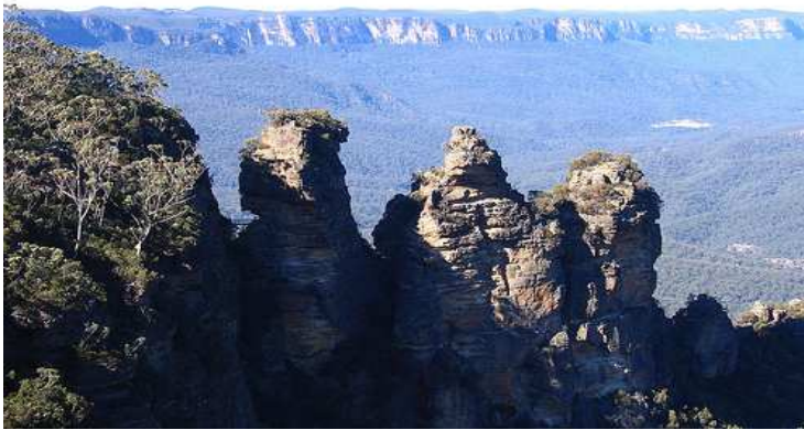
Three Sisters, Echo Point lookout, Katoomba

Dit is reeds donker toe die trein om 17:24 na Sydney vertrek. Dit was 'n heerlike dag. Volgende keer sal ek 'n nag in Katoomba oorbly, by stop no 19 in plaas van 18 begin stap, 'n paar uitkykpunte besoek wat ek oor- geslaan het, en ek sal by die parkeerarea die bruggie benut wat die eskarpement met een van die Three Sisters verbind. En ek sal 'n blikkie soutvleis of tuna vir middagete eet in plaas van daardie duur sop.