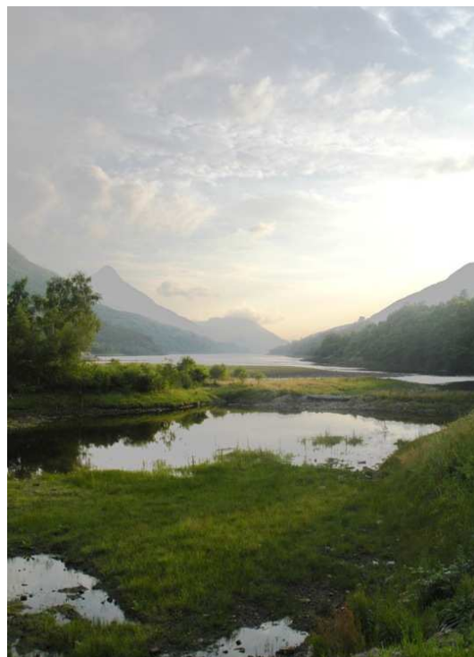
Loch Leven langs die dorpie Kinlochleven

Ons besef veral dat ons deel was van die mooiste natuurtoenele van die Britse Eilande. Wat 'n voorreg!