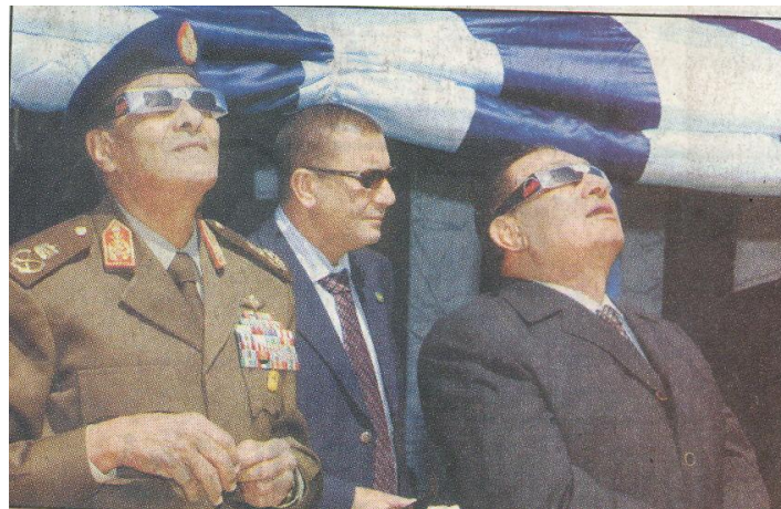
DIE GENERAAL, die lyfwag en DIE PRESIDENT

Egipte se president Moebarak het in 'n helikopter opgedaag, vergeesels van lyfwagte en 'n generaal of iets vol medaljes. Die lyfwagte was nie toegerus met geskikte brille nie want hulle was nie toegelaat om na die verduistering te kyk nie: hulle moes die president oppas. Die lewe kan nogal onregverdig wees as mens nie jou werk reg kies nie..